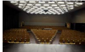
Aula 550 Sitzplätze