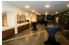
Foyer, mit Catering